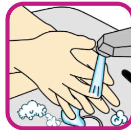
8. Handen afspoelen