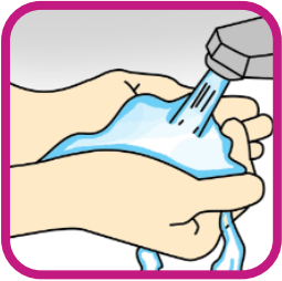
1. Handen nat maken