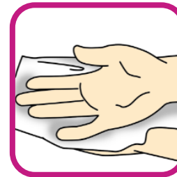
9. Handen afdrogen