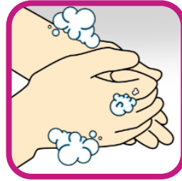
3. Tien seconden wrijven