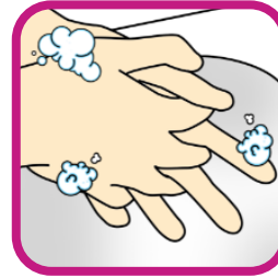
4. Tussen de vingers